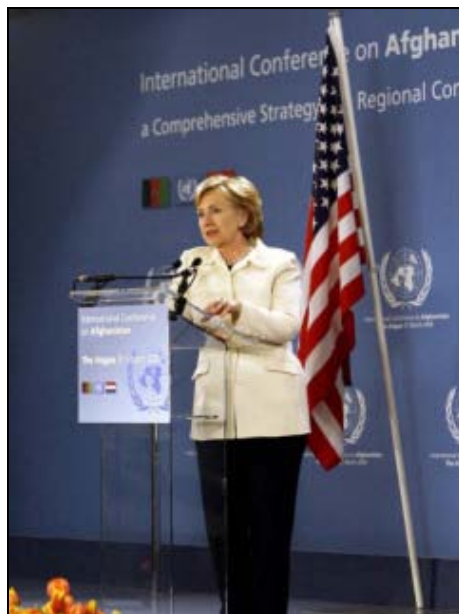
A Conferencia Internacional sobre Afganistán organizada pola secretaria de Estado estadounidense, Hillary Clinton (foto), celebrada o pasado 31 de marzo na Haia (Países Baixos), reuniu a 93 países.

A principios de febreiro de 2009, Barack Obama anunciou o reforzamento do contingente militar estadounidense baixo o mando da OTAN en Afganistán, denominado Forza Internacional de Asistencia á Seguridade (International Security Assistance Force, ISAF). Neste momento, Obama prometeu o envío de 17.000 efectivos cara o país centroasiático, así como outros 4.000 para labores de instrución do incipiente exército dese país.