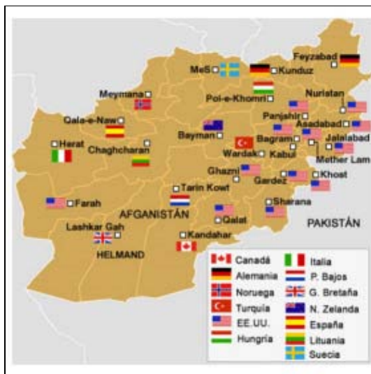
Composición e localización territorial das forzas internacionais da ISAF asentadas en Afganistán. [Fonte: ©ISAF].

Deste modo, o compromiso do goberno de Zapatero está así claramente definido: manter a estratexia de Obama de propiciar maiores esforzos e investimentos ao plan de reconstrución civil, a fin de mellorar as condicións de vida da poboación afgana e asegurar maiores cotas de lexitimidade social para o goberno de Karzai, especialmente de cara aos próximos comicios presidenciais.