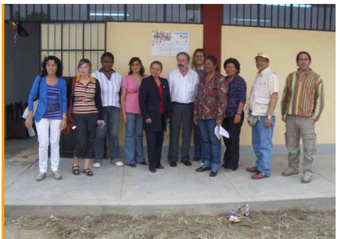
Membros da executiva e da secretaría técnica do Fondo Galego, Tierra de Niñ@s e Colexio Cañete, durante o acto de inauguración dunhas aulas