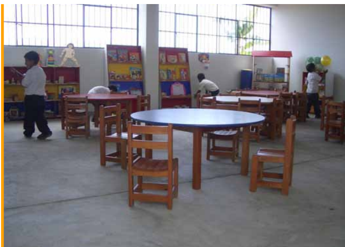
Inauguración dunha aula de educación infantil no Colexio Cañete, esnaquizado tras o terremoto de 2007