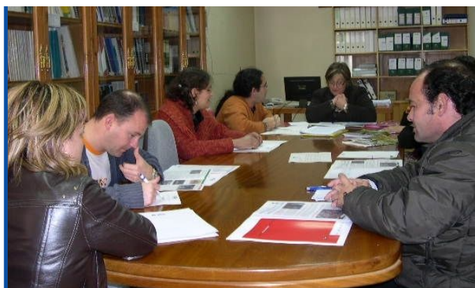
Momento do encontro da Rede Municipalista en Mos.

Recolléronse suxestións, dúbidas e críticas, a través das intervencións das e dos participantes nas reunións e dunha breve enquisa. Elementos que serán analizados coa maior dilixencia, atención e rigor, a fin de mellorar o traballo do Fondo Galego en xeral e do labor da súa Secretaría Técnica en particular.