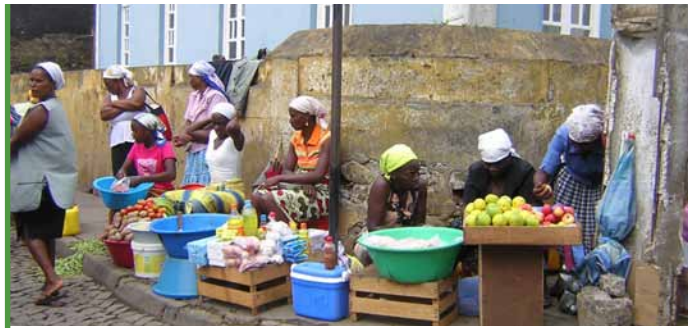
Detalle do Mercado de Assomada, que ten lugar nos sábados pola mañá no mesmo centro da Illa de Santiago.