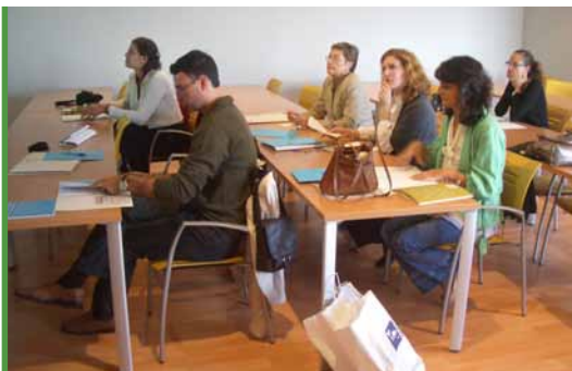
Imaxe do primeiro curso de formación en Cooperación e Solidariedade, nas xornadas celebradas en Vigo

Durante os meses de novembro e decembro desenvóléronse os cursos Cooperación Internacional I e Educación para o Desenvolvemento I, nas cidades de Vigo, Santiago, Allariz e Lugo. Os cursos dirixíronse ao persoal dos Concellos e Deputacións vinculado ao Fondo Galego, con tres obxectivos fundamentais: