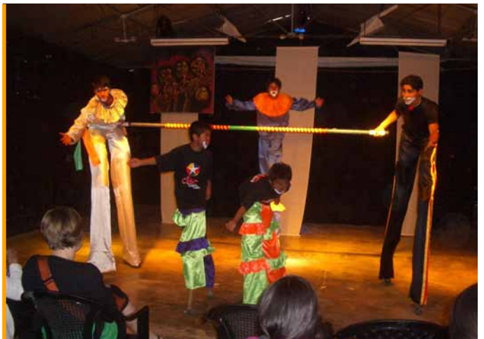
Cijac, Centro Cultural nos que os nenos do asentamento de Villa Salvador aprenden teatro e danza