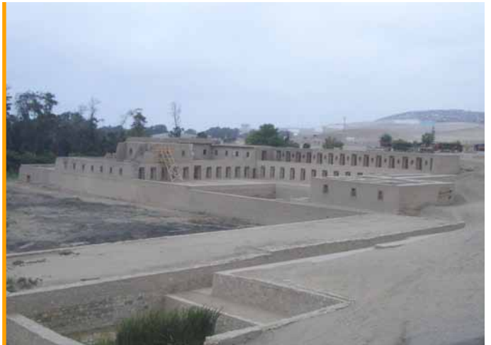
Templo de Pachacamac, do século XV, pertencente ao estado Inca e na ruta turística; reconstruído coa axuda do Fondo Galego

Os obxectivos da visita a Perú cumpríronse, confirmándose o nivel de implicación e participación dos membros de Tierra de Niñ@s, e alimentándose a gana de continuidade por parte do Fondo. Fortalecidos os vínculos, contamos con seguir contribuindo ao desenvolvemento endóxico do país andino.