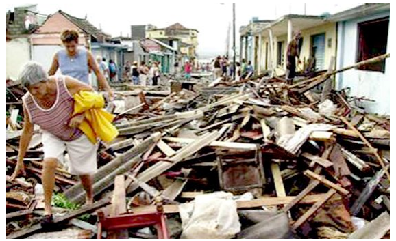
Destrución causada polo furacán Ike ao seu paso por Cuba

Continúa aberta a conta de emerxencia do Fondo Galego para facer fronte á demanda de axuda internacional en Cuba. A axuda canalízase para contrarrestar a devastación producida tralo paso dos furacáns Gustav e Ike durante o 30 de Agosto e o 9 de Setembro, nas provincias de Pinar del río, Holguín, las Tunas, Camaguey e Isla de la Juventud, que deixaron máis de 500.000 persoas sen fogar. A conta é unha xanela aberta para demostrar a solidariedade entre os concellos e deputacións de Galicia con Cuba, país ao que nos unen lazos afectivos e históricos de importantísimo calado nas dúas sociedades.