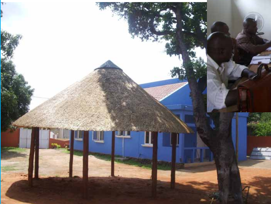
Axencia de Desenvolvemento Económico Local (Maputo)

Como prioridade estableceuse a procura de parcerías baseadas na complementariedade e a coordinación coas accións de actores xa asentados no terreo. Tamén a eficiencia das intervencións, a selección dos proxectos, e por outra banda, co obxectivo da identificación de posibles accións a desenvolver, puidéronse visitar algúns proxectos xa en execución e outros que abrían as portas a unha posible parcería co Fondo Galego.