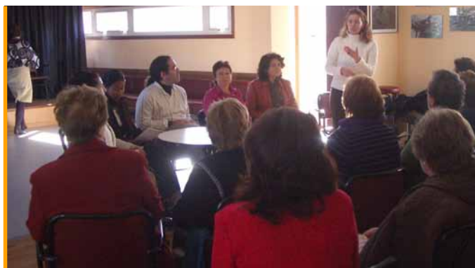
Coloquio na Casa Rosada, en Poio, coa participación das dúas nicaraguanas e numeroso público

Unha medida preventiva, para extinguir a enfermidade do chagas, é a mellora das condicións de vida das comunidades rurais; motivo polo que se investiron 308.770,26 de euros na comunidade chorotega de Totogalpa –no departamento de