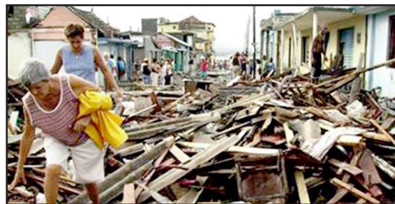
Destrución causada polo furacán Ike ao seu paso por Cuba

O Fondo Galego pon a disposición dos Concellos e Deputacións socias a nosa conta de emerxencia, co fin de canalizar as axudas que dende os entes municipais e provinciais realicen, co obxectivo de apoiar accións na fase de reconstrución de danos.