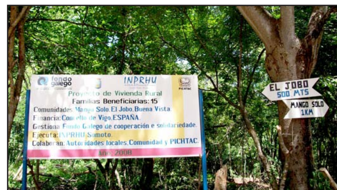
Visibilidade dos proxectos do Fondo Galego no Departamento de Madriz, Nicaragua

Durante a inauguración procedeu á realización dunha rendición pública de contas, lectura orzamentaria e nomeamento de cada beneficiaria ou beneficiario das vivendas, procedéndose, de xeito simbólico, á entrega dos títulos de propiedade. Durante a celebración leváronse a cabo diferentes manifestacións culturais, algunhas de rescate cultural do pobo indíxena, como o baile de La Palma, así como outras actividades de educación ambiental cos membros das comunidades. Instalouse tamén unha pequena