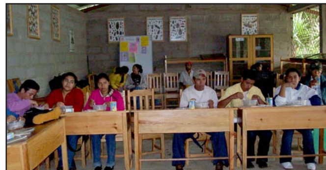
Estudantes do Centro de Educación Alternativa Rural (CEAR), proxecto do Fondo Galego executado por INPRHU-Somoto.

feira de artesanía e produtos agro-ecolóxicos elaborados polas asociacións de ex-alumnos e alumnas dos centros CEAR, tamén financiados polo Fondo Galego.