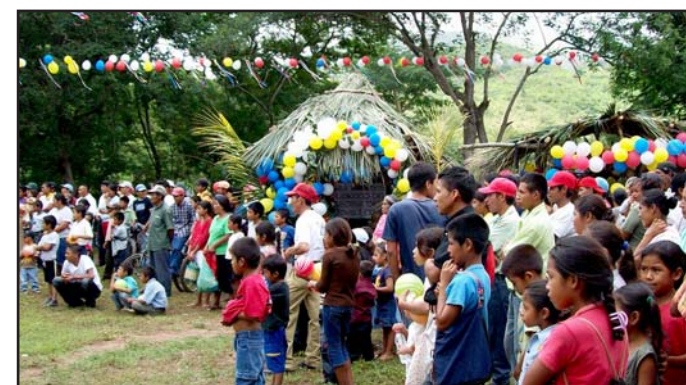
Acto de inauguración das vivendas construídas no marco do proxecto "Mellora das condicións de vida das comunidades rurais do municipio de Totogalpa" do Fondo Galego